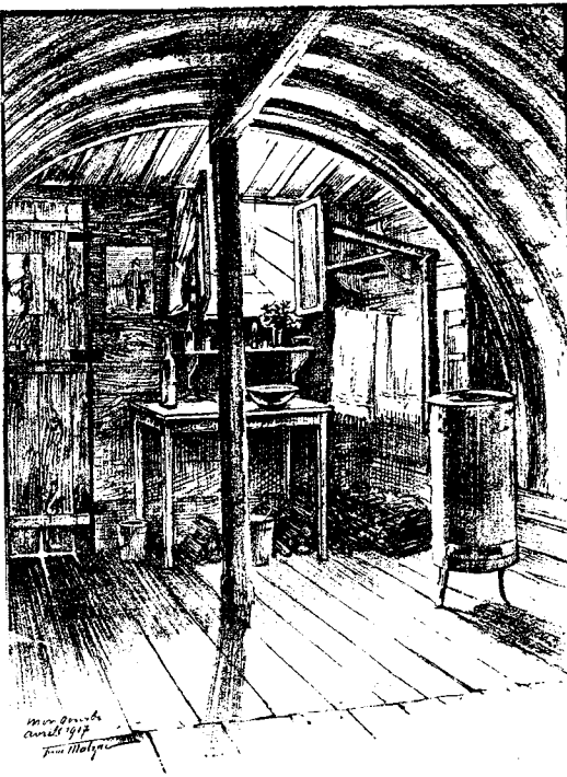
Dessiné au front, par FRANC MALZAO.